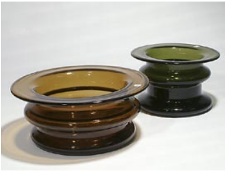
32. Maljakko 2 kpl Novitas Timo Sarpaneva Iittala 1965 sign. TS H 11 cm, D 26 cm H 12,5 cm, D 19 cm