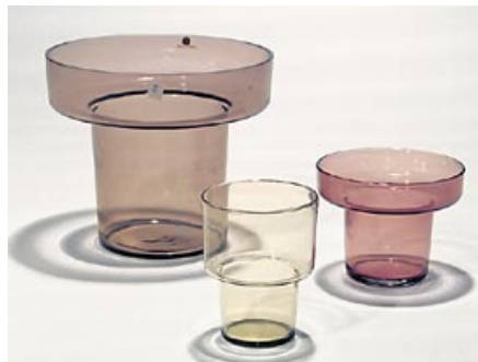
7. Maljakko 3 kpl (L) Viola, Anemone, Achillea 2770–2771 Lisa Johansson-Pape Iittala 1964 pyörittäen puhallettu H 14 cm, 9 cm, 8 cm