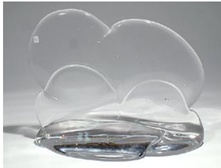
43. Veistos Lasisaari Timo Sarpaneva 1987 Iittala sign. Timo Sarpaneva Iittala 1987 45/500 Valutettua lasia. H 26 cm, D 33 cm