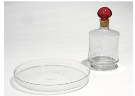
8. Karahvi ja vati (L) Star-käyttölasisarja Tamara Aladin 1960 Riihimäen Lasi Oy H 19,5 cm karahvi D 21 cm vati