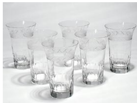
30. Juomalasi 6 kpl Antica olut/whisky Nuutajärvi 1911–1969 H 13,5 cm