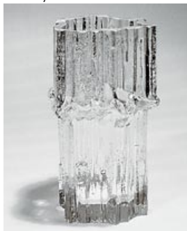
17. Maljakko 3546 Tapio Wirkkala Iittala 1967-1983 sign. Tapio Wirkkala 3546 kiinnipuhallettu, osittain hiottu H 23,5 cm