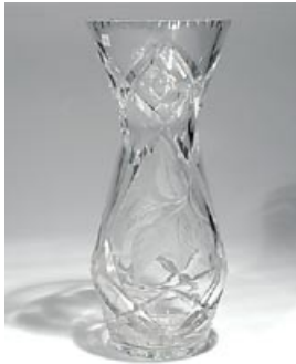
45. Maljakko Terho 6008-2 Riihimäen Lasi Oy 1950-luku hiottua kristallia H 35 cm