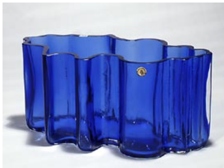
22. Malja Nanny Still Riihimäen Lasi Oy, 1970-luvun alku sign. Nanny Still Riihimäen Lasi Oy kiinnipuhallettu H 13 cm D 27,5 cm