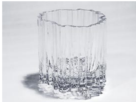
15. Malja Arcadia 3571 Tapio Wirkkala Iittala 1966-1989 kiinnipuhallettu H 14 cm