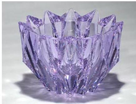
36. Taide-esine Lumpeenkukka Aimo Okkolin 1960 Riihimäen Lasi Oy 1960–1976 sign. Aimo Okkolin Riihimäen Lasi Oy hiottua kristallia, neodymi H 10 cm, D 15 cm