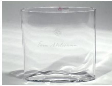
53. Taide-esine Ovalis Tapio Wirkkala 1958 Iittala sign. Tapio Wirkkala kaiverrettu: Eeva Ahtisaari, Suomen vaakuna H 16 cm