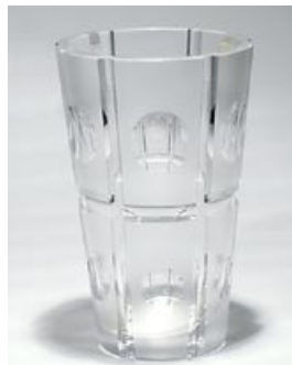
39. Taide-esine Aimo Okkolin Riihimäen Lasi Oy n. 1970 sign. Aimo Okkolin Riihimäen Lasi Oy hiottua kristallia, osittain happohim- mennetty H 20,3 cm