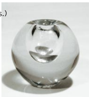
6d. Maljakko (kuvassa vas.) Riihimäen Lasi Oy? puristettu