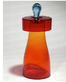
34. Karahvi Lady Jane, uniikki Markku Salo 2006 sign. Markku Salo Nuutajärvi pyörittäen puhallettu H 30 cm