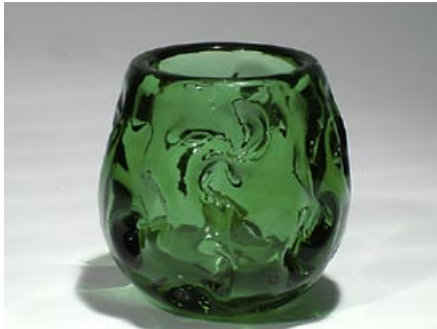
49. Maljakko Riihimäen Lasi Oy 1960-luku? sign. Riihimäen Lasi Oy hyttityönä muovattu H 14,5 cm