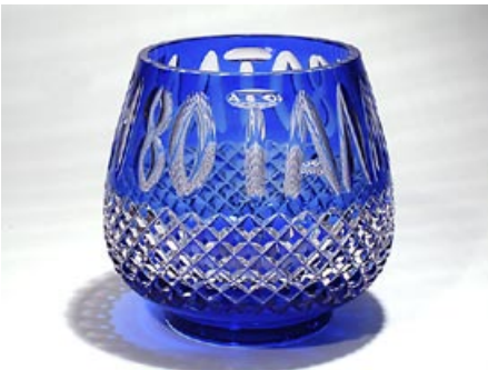
35. Malja Olympiamalja 1980 Neuvostoliitto hiottua verhoakristallia, hionta venäläi- sin kirjaimin TALLIN 80 H 21,5 cm, D 22 cm