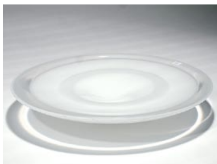
51. Lautanen (vas.) Avanto 2, 3076 Kerttu Nurminen Nuutajärvi sign. Avanto 2 Kerttu Nurminen Nuuta- järvi Notsjö vapaasti puhallettu, driivattu, kerros- opaali H 5,5 cm, D 31,5 cm