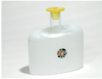
33. Pullo (L) Inari Markku Salo 2004 kiinnipuhallettu, korkki valettu H 19,5 cm