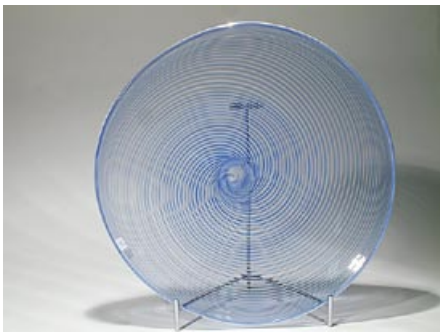
58. Lautanen Filigraanilautanen 3273 Kerttu Nurminen Nuutajärvi sign. Kerttu Nurminen Nuutajärvi Notsjö vapaasti puhallettu, driivattu D 39 cm