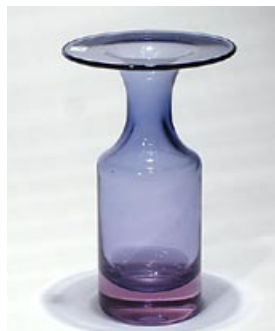
26. Malja 3639 Tapio Wirkkala Iittala 1966–1969 sign. Tapio Wirkkala 3639 pyörittäen puhallettu H 18 cm