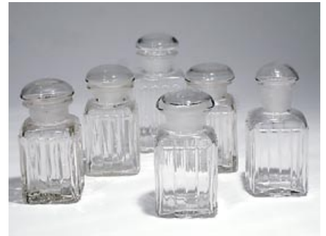
44. Tee- ja maustetölkit 6 kpl 1900-luvun alkupuolelta kiinnipuhallettu, hiottu suu ja tulppa H 15,5 cm–18,5 cm