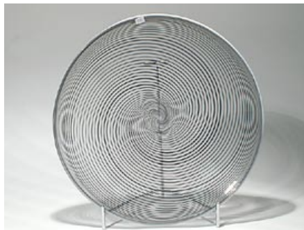
59. Lautanen Filigraanilautanen 3272 Kerttu Nurminen Nuutajärvi sign. Kerttu Nurminen Nuutajärvi Notsjö vapaasti puhallettu, driivattu D 37 cm