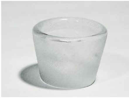
11. Taide-esine 3536 Tapio Wirkkala Iittala 1952-1955 sign. Tapio Wirkkala – Iittala -54 muottiin puhallettu kristalli, kampa- hiottu H 6 cm