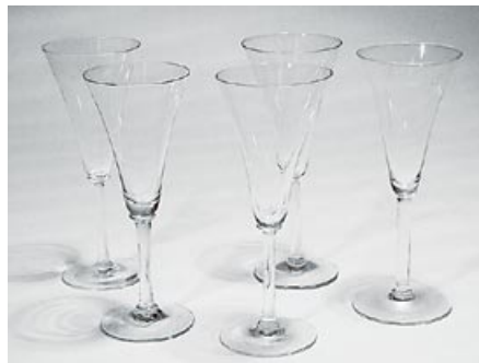
18. Pikari 18 kpl Iittala, Kumela, Nuutajärvi, Riihimäki, Viiala 1911-1980-luvun alku H 18 cm-19 cm