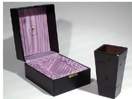
27. Malja ja säilytyskotelo Göran Hongell Karhula 1930-luku hiottua kristallia Säilytyskotelo alkuperäinen, maljakossa pieniä naarmuja ja kolhu. H 18 cm