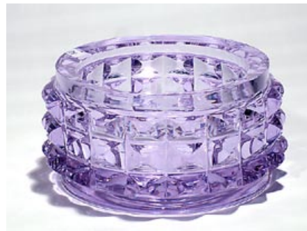
24. Taide-esine Serpentiini Aimo Okkolin Riihimäen Lasi Oy 1965–1972 sign. Aimo Okkolin Riihimäen Lasi Oy neodymi, hiottu kristalli H 8,5 cm, D 17 cm