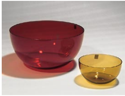
2a. Malja 1329 Kaj Franck Nuutajärvi 1953–1968 pyörittäen puhallettu. D 21,5 cm