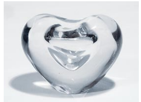
16. Taide-esine Sydän 3557 Timo Sarpaneva 1954 Iittala sign. Timo Sarpaneva Iittala H 9,5 cm, D 12 cm