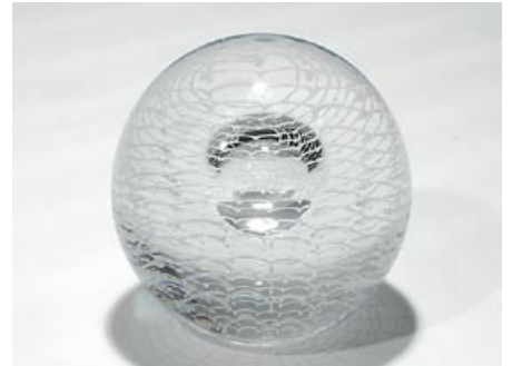
50. Taide-esine Lähde Oiva Toikka 1990 Nuutajärvi sign. Oiva Toikka Nuutajärvi 55/2000 lasilankakoristelu lasin sisällä H 10,5 cm