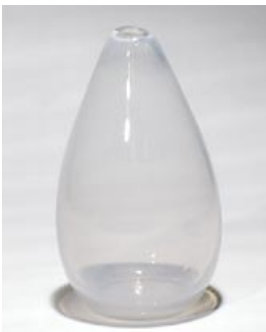
38. Taide-esine 3287=5017 Tapio Wirkkala Iittala 1948, 1949 sign. Tapio Wirkkala Iittala q-lasi, pyörittäen puhallettu H 17 cm