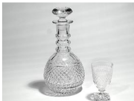
31a. Karahvi (vas.) England Riihimäen Lasi Oy 1920-luku – 1976 H 25 cm