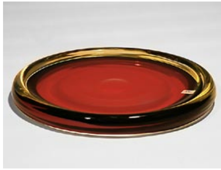
12. Taide-esine Nocturno prototyypä Nanny Still Riihimäen Lasi Oy sign. Nanny Still Riihimäen Lasi Oy hyttityö D 20 cm