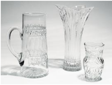
1a. Kaadin (L) pyörittäen puhallettu, hiottu H 23,5 cm