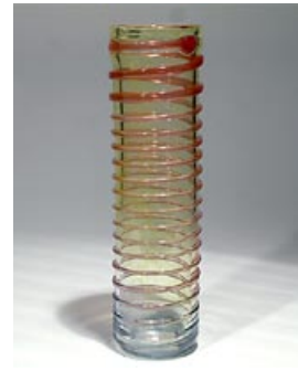
54. Malja (L) Trombi Pro Arte 200, 1993 Tiina Nordström Nuutajärvi sign. T. Nordström Nuutajärvi pyörittäen puhallettu, päällä lasinauha H 36,5 cm