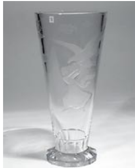
46. Maljakko Riihimäen Lasi Oy 1954 sign. Th. Käppi Riihimäen Lasi Oy -54 hiottua kristallia, kaiverrettu aiheena Eetu Isto: Hyökkäys Jalassa pieniä vaurioita H 33,5 cm