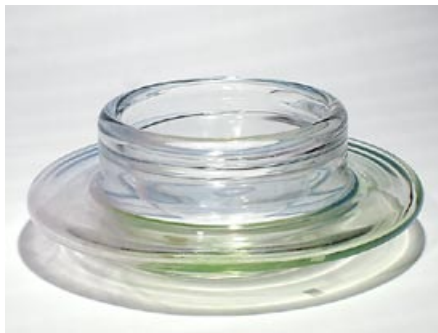
23. Taide-esine Kraateri Helena Tynell Riihimäen Lasi Oy 1973–1975 sign. Helena Tynell Riihimäen Lasi Oy H 11,5 cm, D 30 cm