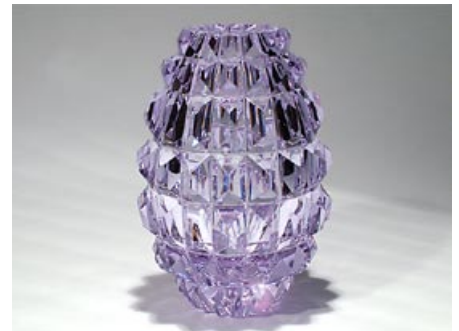
57. Taide-esine Ananas 6568 Aimo Okkolin Riihimäen Lasi Oy 1961–1962 sign. Aimo Okkolin Riihimäen Lasi Oy hiottua kristallia, neodymi H 25,5 cm