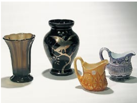
6a. Maljakko (L) H 18 cm Pyörittäen puhallettu, hopeamaalaus.