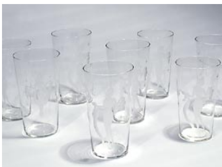
21. Juomalasi 8 kpl (vas.) grogilasi Riihimäen Lasi Oy? Kaiverrus E Käppi? Pyörittäen puhallettu, kaiverrettu. H 13,5 cm