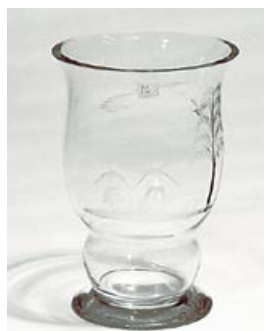
9. Taidekristalliesine (äärimm. vas.) 3555 Timo Sarpaneva Iittala sign. Timo Sarpaneva – iittala -56 tikkupuhallettu H 10 cm