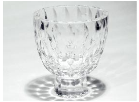
13. Malja 1408 Saara Hopea Nuutajärvi hiottua kristallia H 13,5 cm