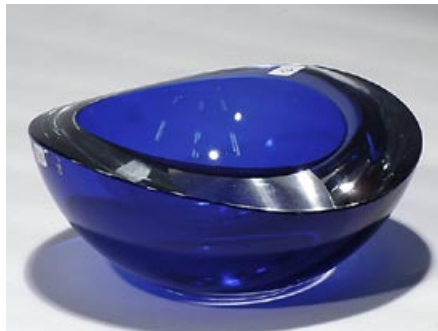
56. Malja Aqqua 3454 Kerttu Nurminen Nuutajärvi sign. AQCUA Kerttu Nurminen Nuuta- järvi Notsjö värialoitus, reuna hiottu H 6,5 cm, D 15,5 cm