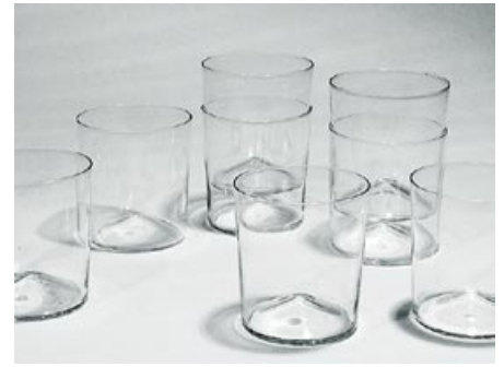
3. Juomalasi 14 kpl 1719 Kaj Franck Nuutajärvi 1953, 1963–1967 pyörittäen puhallettu H 10,2 cm