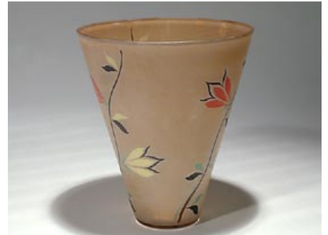
47. Maljakko pyörittäen puhallettu, maalattu Paperietiketti: Käsin maalattu H 23,5 cm, D 20,5 cm