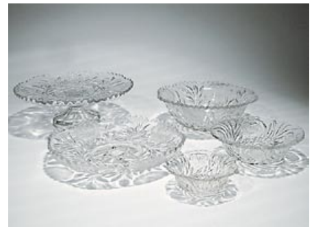
20. Puristelasia 5 kpl Kukka Riihimäen Lasi Oy 1930-luku-1960- luku puristettu, osassa kukka happohimmen- netty D 29,5 cm jalallinen malja D 27,5 cm matala malja D 25 cm syvä malja D 18,5 cm pikkumalja D 13 cm sokerikko