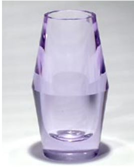
42. Taide-esine Hella 6565 Aimo Okkolin Riihimäen Lasi Oy 1961–1968 sign. Aimo Okkolin Riihimäen Lasi Oy hiottu neodymikristalli H 17 cm