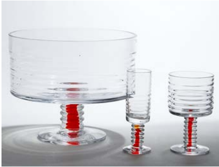
41 Taidelasi, IKILIIKKUJA , 3 osaa Nanny Still Riihimäen Lasi Oy. 1) D 200 mm, H 165 mm, 2) D 65 mm, H 115 mm ja 3) D 35 mm, H 120 mm.