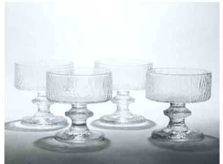
16 Jälkiruokamalja, SENAATTORI 4 kpl alkuperäispakkauksessa. Timo Sarpaneva Iittala 1968–1980, D 95 mm, H 98 mm. (L)