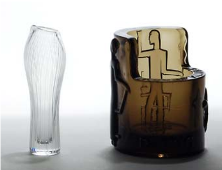
24 Kaksi esinettä 24a) Varsanjalka , Tapio Wirkkala Iittala 1955, signeerattu, viivahiottu kirkas kristalli H 110 mm. 24b) Rettig-savukeastia , Gunnar Finne Karhula, muottisigneeraus, ruskea puristelasi H 100 mm.