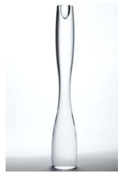
23 Kynntilänjalka, MARCEL Timo Sarpaneva Iittalan lasitehdas 1992, signeerattu, kirkas, D 66 mm, H 415 mm.