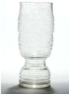
14 Maljakko Kaj Franck Nuutajärvi 1971, kirkas vinorakkokuvio D 95mm, H 200 mm. (L)