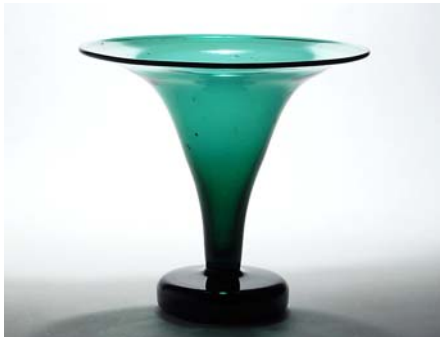
11 Taidelasi, SUIHKULÄHDE Arttu Brummer Riihimäen Lasi Oy 1940-luvun lopulta – v. 1951. Vihreä, D 180 mm, H 168 mm.