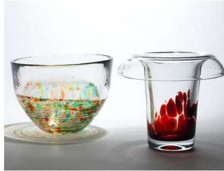
22 Kaksi taidelasia 22a) Aimo Okkolin Studiolas Oy 1981, signeerattu, kirkasta ja punaista D 180 mm, H 160 mm. 22b) Atolli -malja, Oiva Toikka Nuutajärvi 1977–78, signeerattu, kirkas sekä punaista ja vihreää D 140 mm, H 190 mm.