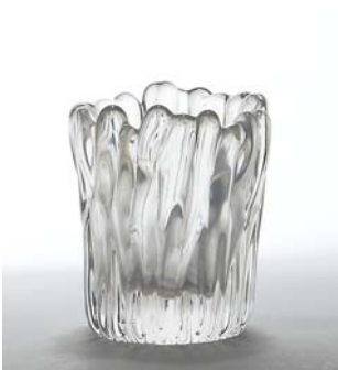
27 Jäkälämaljakk Tapio Wirkkala Iittala, suunniteltu 1950, signeerattu, D 75 mm, H 90 mm.