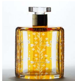
28 Viskikarahvi Karhula, kirkasta ja ruskeaa lasia D 120 mm, H 180 mm.