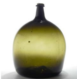
20 Mahapullo sivuilta hieman litistetty, samma- lenvihreä, D 270 mm, H 350 mm, 1800-luku.