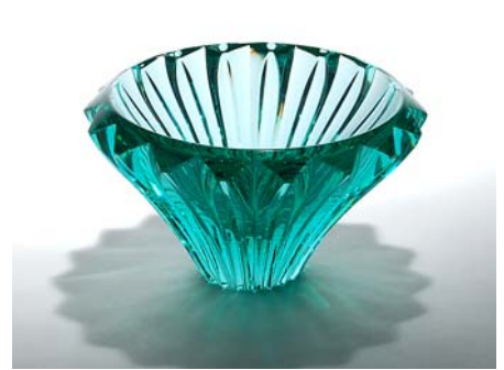
43 Taidelasi kristallia, TERÄLEHTI Aimo Okkolin Riihimäen Lasi Oy, signeerattu, vihreä D 200 mm, H 115 mm.