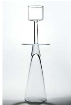
12 Taidelasi PAX Pro Arte, Oiva Toikka Nuutajärvi 1994–1996 kirkas, D 130 mm, H 410 mm, signeeraus Oiva Toikka Nuutajärvi.