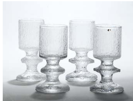
15 Snapsilasit, SENAATTORI 4 kpl alkuperäispakkauksessa, Timo Sarpaneva Iittala 1968–1980, D 48 mm, H 112 mm. (L)