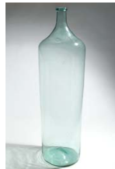
19 Ns. tislattun veden pullo läpinäkyvä D 240 mm, H 860 mm, 1800-luvun jälkipuoli.