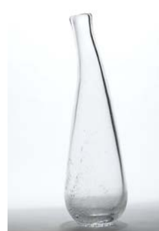
26 Taidelasi, VIINAPULLO Kaj Franck Iittala, signeerattu, kirkas kuplainen H 280 mm.