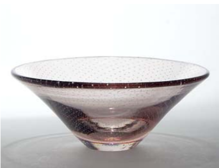
30 Taidelasi, malja GN 11 v. 1947, Gunnel Nyman, Nuutajärvi 1947–54, hieman kulunut signeeraus, vaalea violetti D 185 mm, H 75 mm.