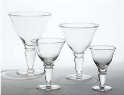
21 Lasisto H.E. Henry Ericsson Osakeyhtiö Riihimäki 1930-luku, eri kokoja yht. 27 osaa.