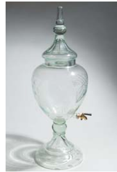
13 Boolimalja kuvioitu, hanallinen, kirkas D 280 mm, H 770 mm.