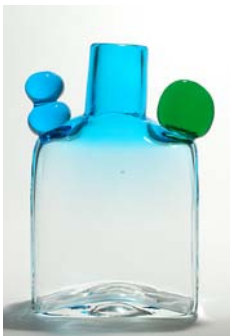
17 Taidelasi, Pullo N 526 Oiva Toikka Nuutajärvi 1970-1972, signeerattu, turkoosi ja vihreä H 160 mm.