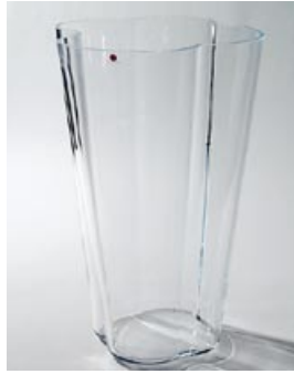
22 Maljakko. Kirkas, littala, D 230 mm, H 360 mm, signeeraus: Alvar Aalto 36/1995.