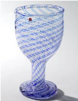
57 Taidelasi. Filigraanipokaali, kirkas/sininen-valkoinen, (1990-luku), D 130 mm, H 225 mm, signeeraus: O. Toikka Nuutajärvi.