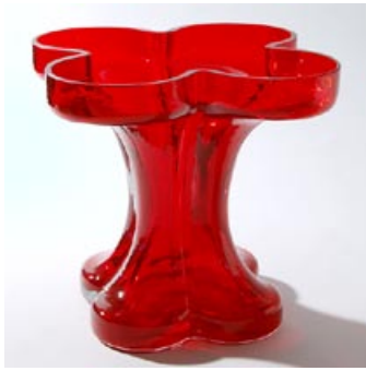
51 Maljakko. "Onnenlehti" tuotenumero 1410, tummanpunainen, Riihimäen Lasi Oy 1972-76 Helena Tynell, lev. 275 mm, H 230 mm.