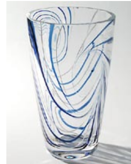
59 Taidelasi filigraanimaljakko Madonna , uniikki, suunnitellut ja valmistanut Kari Alakoski, kirkas/sininen-valkoinen, D 150 mm, H 320 mm, signeeraus: Kari Alakoski Nj 09.