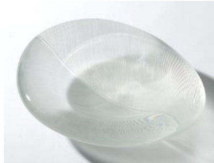
28 Taide-esine. Vati, kirkas kampahiottu, litalan tuote no 3337, kuvastot 1952-60 ja 1980– pieniä numeroituja eriä, lev. 150 mm, pit. 180 mm, signeeraus: Tapio Wirkkala littala.