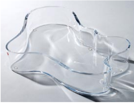
21 Malja. Kirkas, littala 1986–, lev. 380 mm, H 55 mm, signeeraus: Alvar Aalto littala.