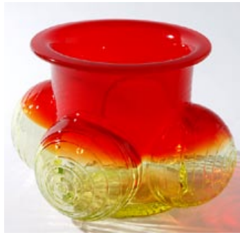
52 Maljakko. "Pajazzo", punainen/keltainen, Riihimäen Lasi OY 1971-74 Nanny Still, lev. 230 mm, H 150 mm.