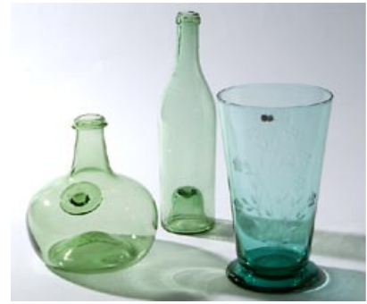
53 Kolme esinettä. 53 a) Karhula Göran Hongell, muoto esiintyy 30-luvun vientikuvastossa, D 120 mm, H 200 mm. 53 b) Konjakkipullo 1930-luku. 53 c) Sinettipullon kopio, "uusi tuote".