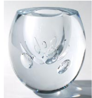
29 Taidelasi. Claritas , kirkas, D 160, H 170, signeeraus: Timo Sarpaneva littala 2005.