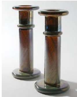
25 Taidelasi. Kynttilänjalka 2 kpl, sinivihreä-rus- kea-lysteroitu filigraani, Heikki Orvola 1980-luku, D 110 mm, H 240 mm, signeeraus: Heikki Orvola Nuutajärvi Notsjö.