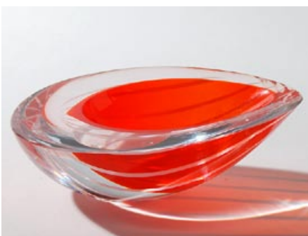
30 Taidelasi. Kirkas/punainen/valkoinen, Kerttu Nurminen lev. 160 mm, syvyys 120 mm, H 55 mm, signeeraus: K.N kokeilu Nuutajärvi. Sama muoto kuin Nurmisen "Pisara"-maljoissa 1990- luvulta 2000 alkuun.