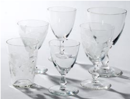
24 Savoy-lasisto. Kirkas, hiottuja ja hiomattomia usean kokoisia lasia yhteensä 36 osaa, Riihimäen Lasi Oy 1946-67.