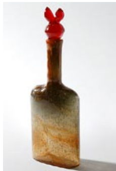
55 Taidelasi. Puteli ja tulppa, ruskea/harmaa rakkolasi, Nuutajärvi 1975-77, signeeraus: Oiva Toikka Nuutajärvi Notsjö.