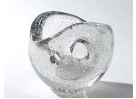
23 Taidelasi. Hiidenhelmi , littala 1951-60, kirkas- kuplainen, lev. 160 mm, H 140 mm, signeeraus: Timo Sarpaneva littala.