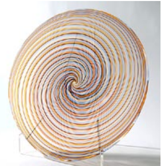
26 Taidelasi. Vati, sini-puna-oranssi-kirkas filigraa- ni, D 380 mm, signeeraus: Kerttu Nurminen Nuutajärvi 7/2005.