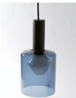
60 Design valaisin. Riippuvalaisin K2-141 , kaikki osat tallella, Tapio Wirkkala 1960, Idman / littala, lasikupu siniharmaa D 145 mm ja H 175 mm.