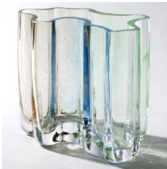
54 Taidelasi. "Sokkelo", kirkas-ruskea/sininen/vihreä värijauhe, Riihimäki 1970-76, lev. 180 mm, H 175 mm, signeeraus: Riihimäen Lasi Oy Helena Tynell.