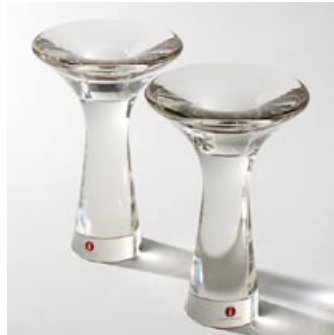
58 Taide-esineitä. 2 kpl kynttilänjalkoja tuote no 3412, littala, kuvastot 1954-71, D 95 mm, H 150 mm, signeeraus: Tapio Wirkkala 3412.