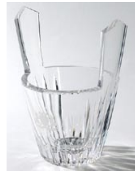
56 Taidelasi. "Haarikka", kirkas hiottu kristalli, mahdollisesti 50/60-lukujen taite, lev. 130 mm, H 200 mm, signeeraus: Riihimäen Lasi Oy Aimo Okkolin, monogrammina Mallasjuoman logo.