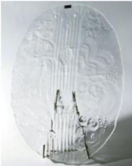
27 Riipus. Esplanadi , Oiva Toikka, Nuutajärvi 1979-80, kirkas, lev. 285 mm, pit. 410 mm.